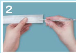
②ディスポカバーを 取り付ける