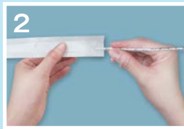
②ディスポカバーを取り付ける