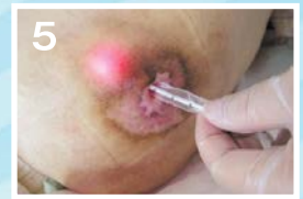
⑤最深部に到達した時点で、皮膚表面に透過されたライトをガイドにして、ポケットサイズを計測する。