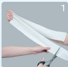
①長い場合は必要な長さにカットします。

腕の場合 折り返して二重に使用するパターン ※二重に着用することで2倍弱の圧迫圧になります。