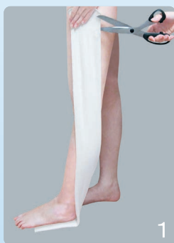
①長い場合は必要な長さにカットします。