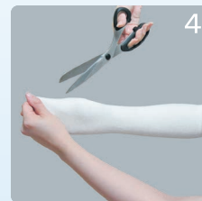
④親指を出す部分に切り込みを入れてください。