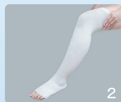
②生地にシワができないように引き上げ、装着してください。