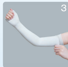
③残り半分を折り返しながら上に引き上げます。