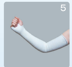
⑤親指を通します。生地にシワがないかを確認してください。