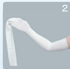
②生地を半分を腕に通します。