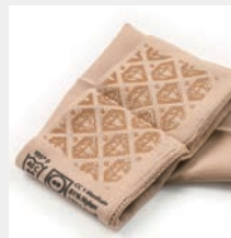
ずり落ち防止加工