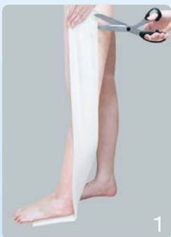
①長い場合は必要な長さにカットします。