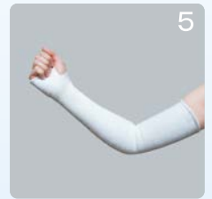
⑤親指を通します。生地にシワがないかを確認してください。