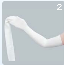
②生地を半分を腕に通します。