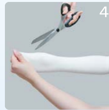
④親指を出す部分に切り込みを入れてください。