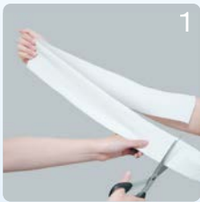
①長い場合は必要な長さにカットします。

折り返して二重に使用するパターン ※二重に着用することで2倍弱の圧迫圧になります。