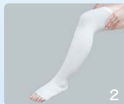
②生地にシワができないように引き上げ、装着してください。