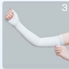
③残り半分を折り返しながら上に引き上げます。