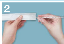
②ディスポカバーを取り付ける