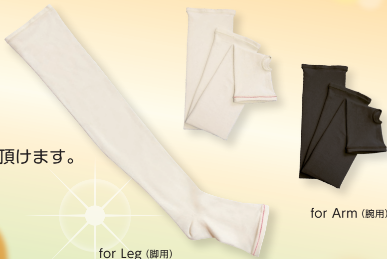
for Leg (脚用)